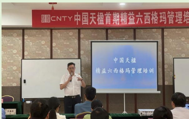
中国天楹精益六西格玛管理培训现场

人才的培养与发展是公司战略达成和业务发展的重要保障。在“环保+新能源”双轮驱动战略指导下，公司依托“天楹大学堂”搭建了人才培养与赋能体系大厦，用线上线下相结合的方式开展全方位的人才培养，为公司可持续发展提供保障。培训的内容涉及到了企业文化、职业素质、工作技巧、管理技能、专业技能/技术、安全环保各个模块，培训对象除了新入职员工、办公室职员、生产类员工、研发类员工、管理人员外，还包括市场拓展人员、项目运营人员和重点群体的梯队储备人员。