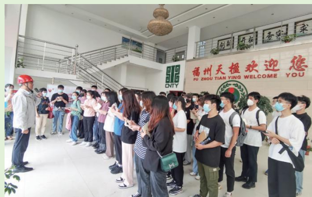
福州大学环境与资源学院师生参观福州楹能