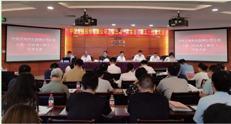
工会三届一次会员代表大会现场

满意度调查，调查结果直接向高层领导汇报；同时，对于适合公司的合理化建议，公司将立项跟进，并在公司内部报刊跟踪反馈，并且每年评选优秀建议，对有价值的提案给予表彰及奖励。