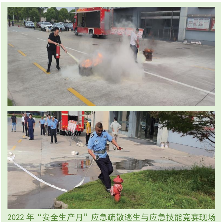
2022 年“安全生产月”应急疏散逃生与应急技能竞赛现场

公司遵守国家安全法律法规与行业标准，通过制定《安全生产管理办法汇编》，建立起安全可靠的生产环境和生产流程，以“安全第一，预防为主，综合治理”为总方针，遵循统一领导、统一指挥、紧急处置、快速反应、分级负责、协调一致的原则，坚持做到作业过程中一旦出现重大安全事故及重点安全风险，能够迅速、快捷、有效的启动应急救援系统。公司不仅建立产品质量安全保障机制与产