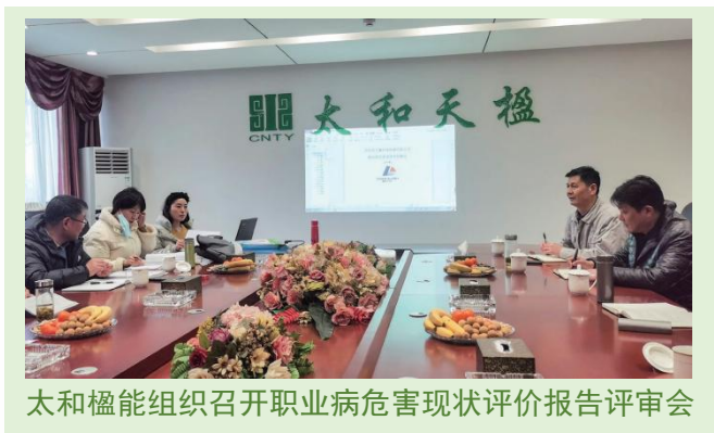
太和楹能组织召开职业病危害现状评价报告评审会

卫生防护意识。公司每年都委托具有资质的职业卫生技术服务机构对生产作业环境的职业病危害因素进行检测并及时公示检测结果，每三年委托具有资质的职业卫生技术服务机构进行评估，确保卫生安全生产，从而有效的防治职业病。