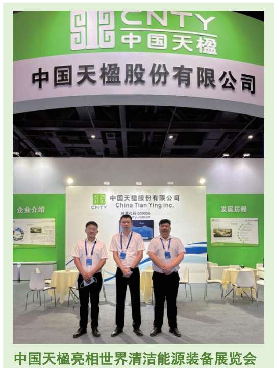
中国天楹亮相世界清洁能源装备展览会

在国家积极推动双碳目标实现的背景下，公司将气候承诺纳入公司使命，将碳减排纳入企业经营考虑范围，主动承担对自然、社会、人文环境的责任，推动社会不断前行、可持续发展。