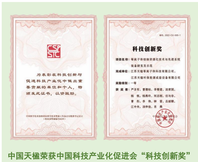
中国天楹荣获中国科技产业化促进会“科技创新奖”

截止 2022 年底，经过科研人员的不懈研发和技术创新，公司及下属子公司已拥有授权专利 608 项，其中发明专利达 71 项，软件著作权登记 60 项，主编和参编国家标准 8 项，行业标准 6 项，地方标准 9 项，团体标准 26 项，发布企业标准 81 项。