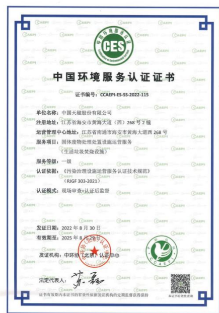
中国天楹两项污染治理设施运营服务顺利通过一级认证

回顾和评估环境管理成果，对不符合公司环境保护制度的行为予以纠正，并采取相应补救措施；同时积极应用先进的节能减排技术，推动实施技术改造，提高能源利用效率，减少污染物排放，持续提升环境管理水平。2022 年，公司所有污染物均达标排放，未产生因污染物超标或违规排放而导致的环保处罚。